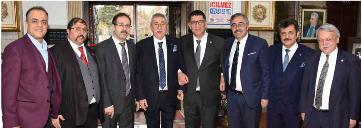
AESOB Başkanı Adlıhan Dere, TESK Genel Başkanı Bendevi Palandöken ve TESKOMB Genel Başkanı Abdulkadir Akgül ile TESK Meslek Eğitimini Geliştirme Kurulu Toplantısı öncesi bir araya geldi.