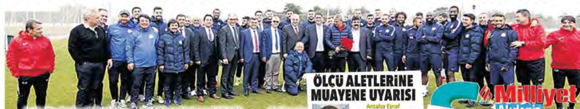
Antalya Esnaf ve Sanatkarlar Odaları ile birlikte tesisleri gezerek bilgi aldı. Ziyaretin öne geçmesiyle...